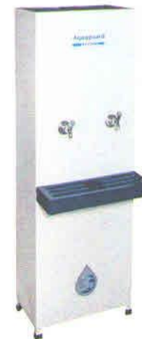
Institutional Reverse Osmosis Water Purification Systems

The Aquaguard REVIVA makes the water both chemically and micro-biologically potable by reducing hardness, TDS, heavy metal contaminants and by removing pathogenic microorganisms there by reviving the original taste of water.